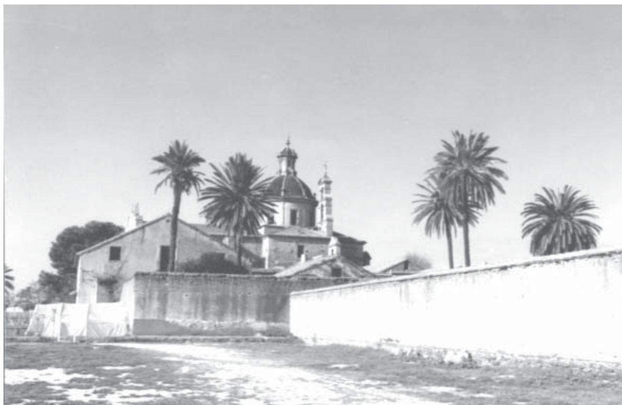
Vista general de la Cartoixa

d'un succint acostament a la història de la fundació —fonamentat també en Ortí—. Mentre que Francesc Tarín i Juaneda, en La Cartuja de Portacoeli (Valencia). Apuntes históricos (1897) 20 , també es referí a la tercera fundació valenciana de l'Orde amb dades de l'autor abans citat, incidint-ne en el paper de fra Antoni Ortiz en la seua edificació.