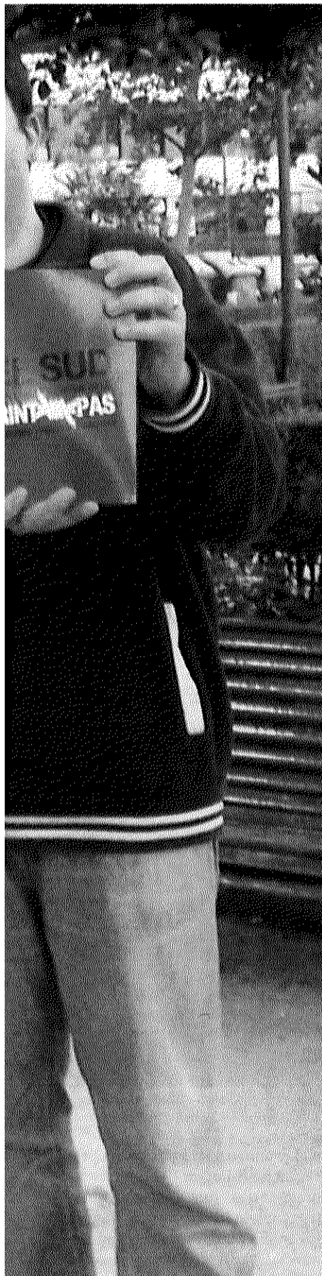
ca dels Obrint Pas